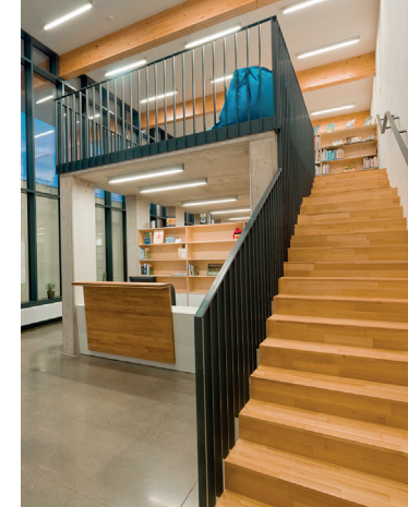
Bílovice nad Svítavou

CO ZDE NAJDEME: informační tabule, stojany na prospekty, přehledně rozdělené podle toho, kdo se prezentuje (knihovna, obec, kulturní události apod.), místo na kočárky, věšáky, skříňky na uložení věcí.