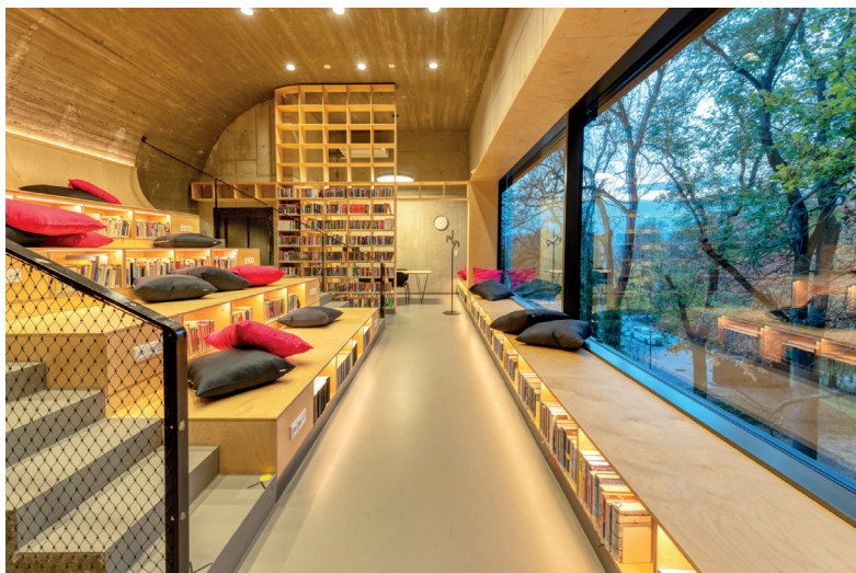
Vratislavice nad Nisou