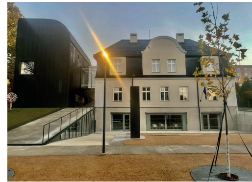
Vratislavice nad Nisou

CO ZDE NAJDEME: stojany na jízdní kola, lavičku, venkovní nástěnku knihovny, podle možností budovy i elektronickou nástěnku, výkladec, bibliobox, knihobox.