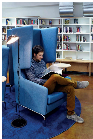
Praha, pobočka Vozovna