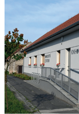
Ostrožská Nová Ves | Kostelní Lhota