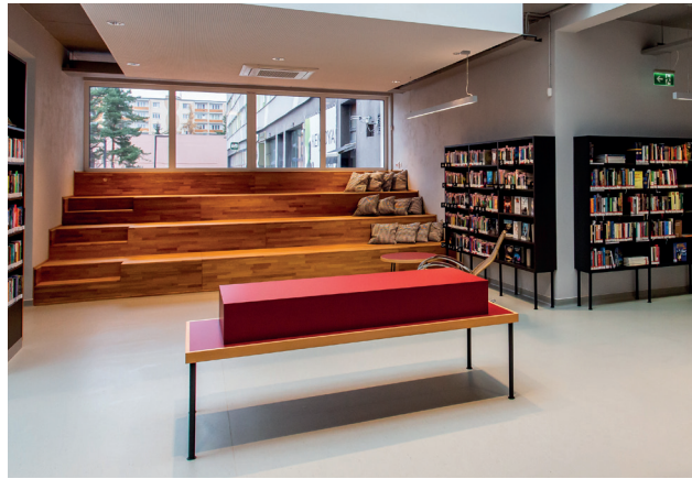
Praha, pobočka Zahrádní Město