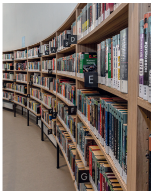
Česká Lípa | Praha, pobočka Jezerka