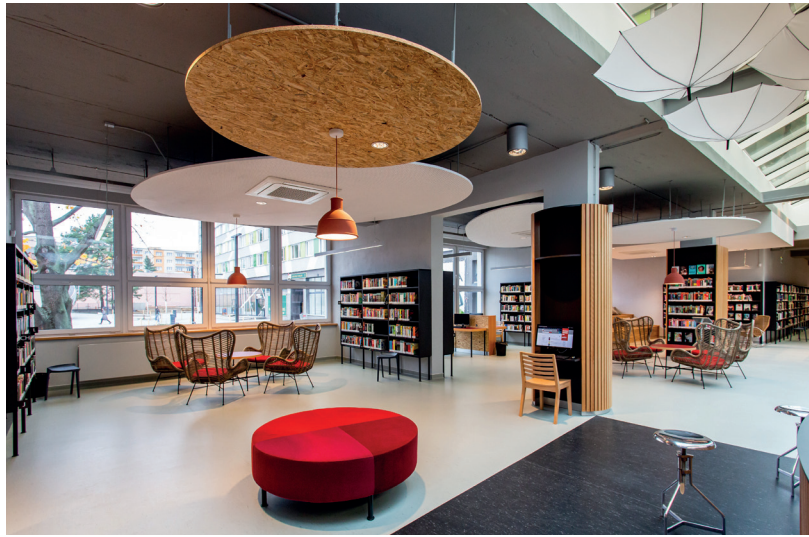
Praha, pobočka Zahradní Město