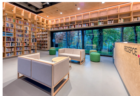
Vratislavice nad Nisou