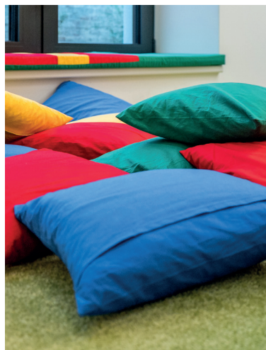
Rychnov nad Kněžnou

VYBAVENÍ: regály čtyřpolicové, max. šestipolicové, různorodé sedací prvky (vaky, hromady polštářů, sedací stupně či „ sedací krajiny “...), místa pro společné čtení rodičů a dětí (pohovky apod.), prolézací koutky, tunely, čtenářská „doupata“ , stavebnicové systémy, herní podložka (popř. ohrádka pro nejmenší), chytrá zeď (stíratelný nátěr – část stěny, na kterou mohou děti kreslit, psát, společně tvořit na velké ploše), edukativní i zábavné hry, magnetické popisovací stěny.