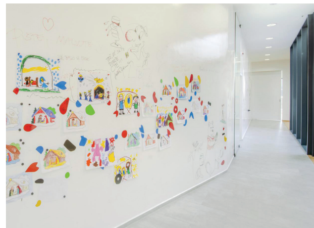
Ostrožská Nová Ves

VYBAVENÍ: sedací vaky, herní křesla, houpací sítě, závěsná křesla , „náhodně“ shromážděné solitérní kusy nábytku, strategické deskové hry, stolní fotbal , kulečnický, playstation , virtuální realita atd.