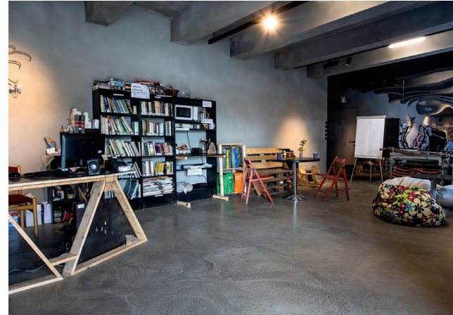
Praha, pobočka DOK 16 – Sousedská dílna