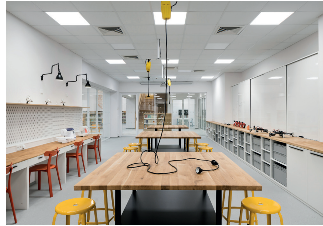
Inovační a vzdělávací centrum International School of Prague

VYBAVENÍ: mobilní stoly, stohovatelné židle , autonomní pracovní stolky spojené s židlí, magnetické nástěnky, interaktivní tabule, flipcharty , audiovizuální technika, místo pro připojení lektorského stolků, tiskárna , kopírka.